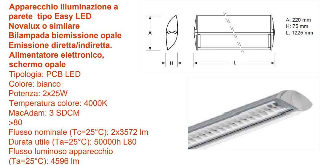
RIFERIMENTO ILLUMINAZIONE A PARETE