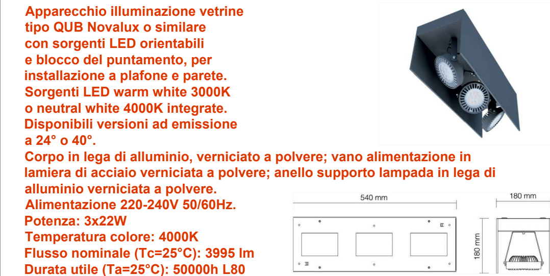
RIFERIMENTO ILLUMINAZIONE VETRINE