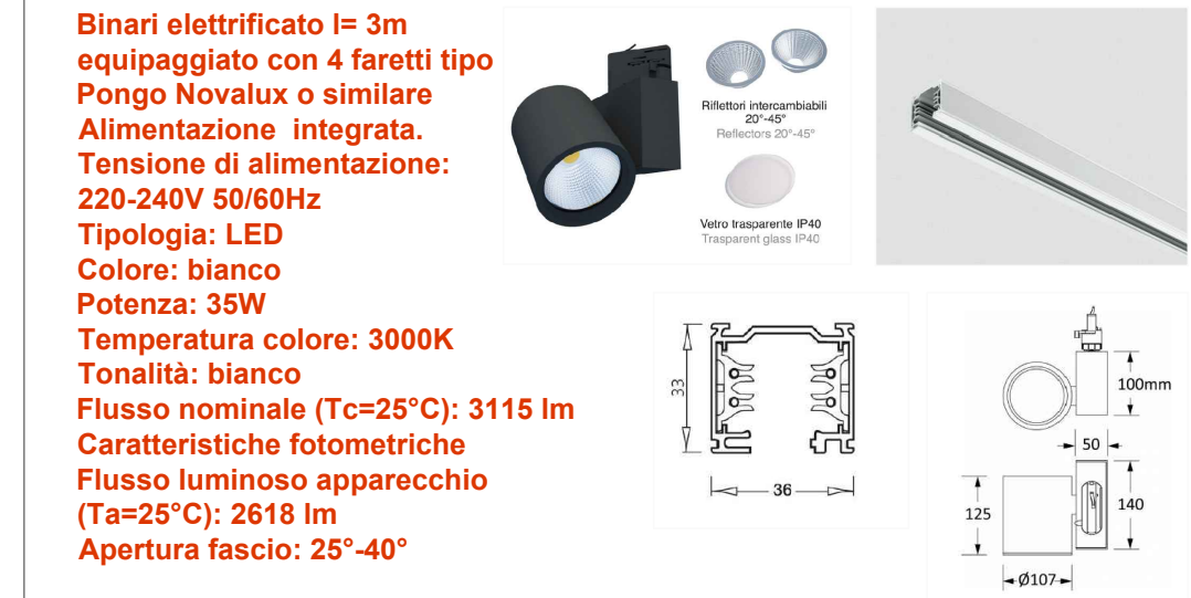
RIFERIMENTO BINARIO ELETTRIFICATO