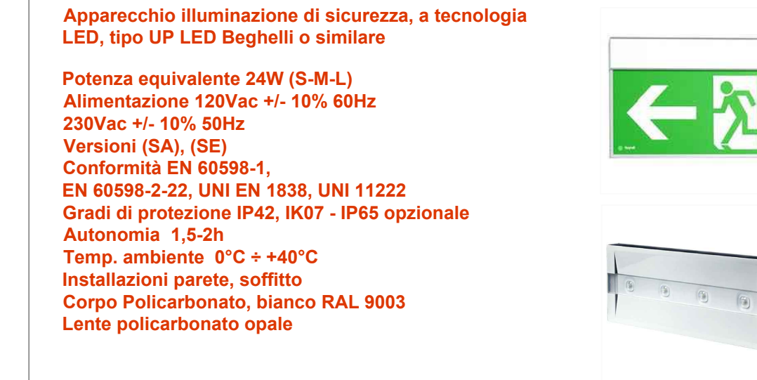
RIFERIMENTO ILLUMINAZIONE DI SICUREZZA